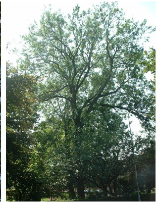
, 04 August 2003