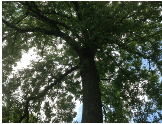
, 02 September 2013