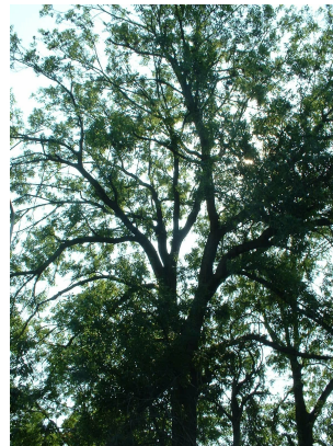
, 04 August 2003